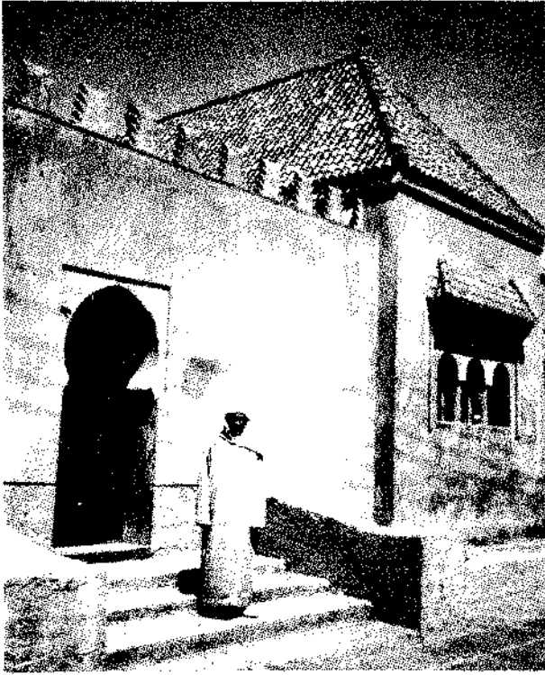
مدخل الضريح ليوسف